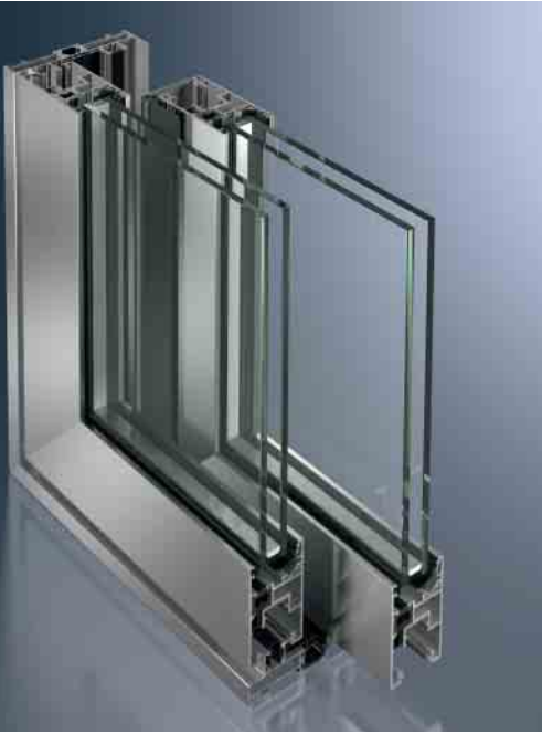
Schüco Schiebesystem ASS 50 Schüco Sliding System ASS 50