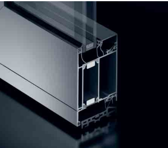
Schüco Tür ADS 70.HI HD Schüco Door ADS 70.HI HD

Die großformatige Tür in besonders robuster Ausführung für hohe Belastungen und stark frequentierte Ein- und Ausgänge.